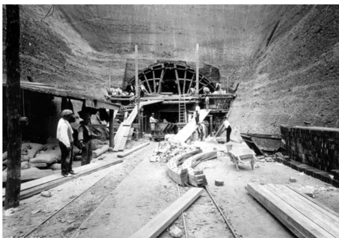
La construcció del túnel del tren de Sarrí va ser una important obra que es dugué a terme poc temps després de tancar la Mina Grott, la qual era vista com una forta competència per a la línia Barcelona - Les Planes.

Farà aproximadament un any uns membres de l'ERE-AEC amb la intenció de filmar un reportatge d'aquesta mina iniciarem les gestions per poder accedir-hi. Val a dir que no fou una tasca fàcil ja que actualment se'n fa càrrec l'empresa d'aigües Sorea que pertany al Grup Agbar. Malgrat aparentment, la mina es troba en un estat d'abandonament, periòdicament es fan tasques de manteniment en les que un tècnic revisa les canonades de seu interior. Es en una d'aquestes revisions en que tenim una oportunitat per visitar-la.